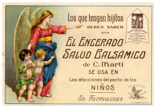
Targetó publicitari, circa 1920