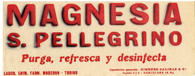
Paper assecant publicitari, c. 1920 Col·lecció FCF